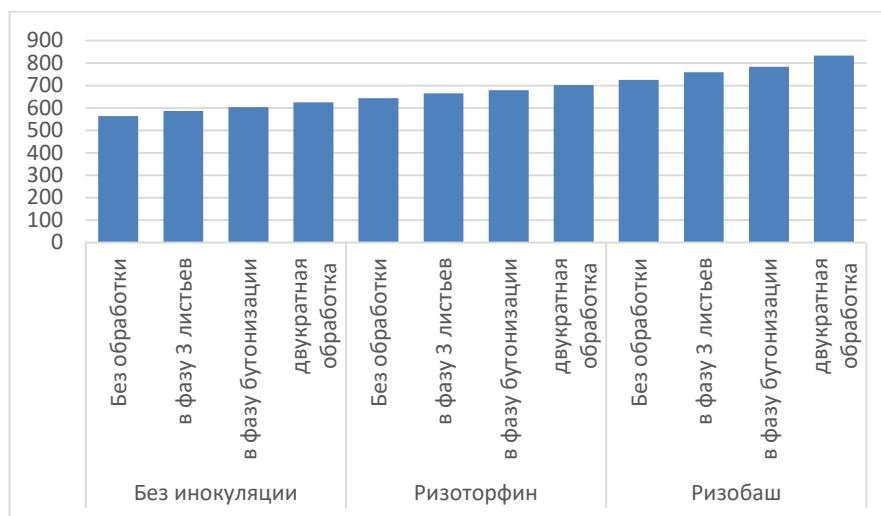
Рисунок 3 – Фотосинтетический потенциал посевов нута, тыс. м 2 ·сут./га, среднее в 2020-2022 гг.

тыс.м 2 ·сут./га, что больше, чем на варианте без обработки, на 498,83 тыс. м 2 ·сут. /га, но меньше, чем на варианте с инокуляцией РизоБаш - 2755,26 тыс. м 2 ·сут./га (рисунок 3).